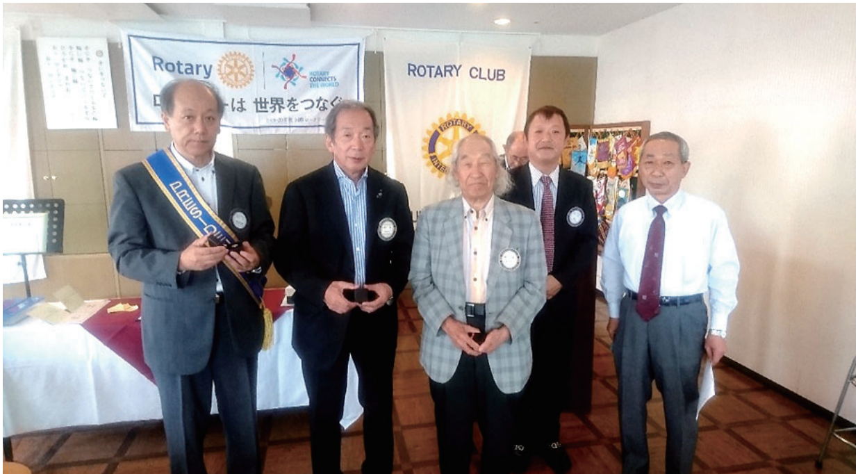
財団寄付者 度会・織戸・藤井・鈴木・山口会員表彰