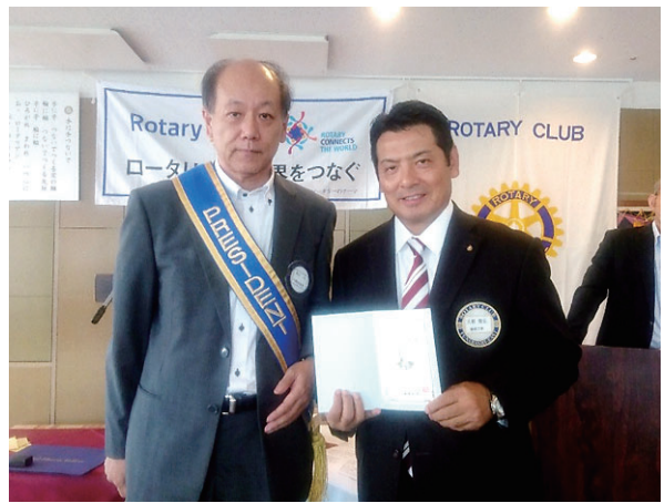
米山功労者表彰 大原会員